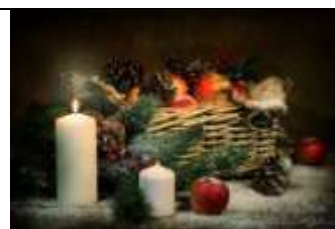
А) Новый год